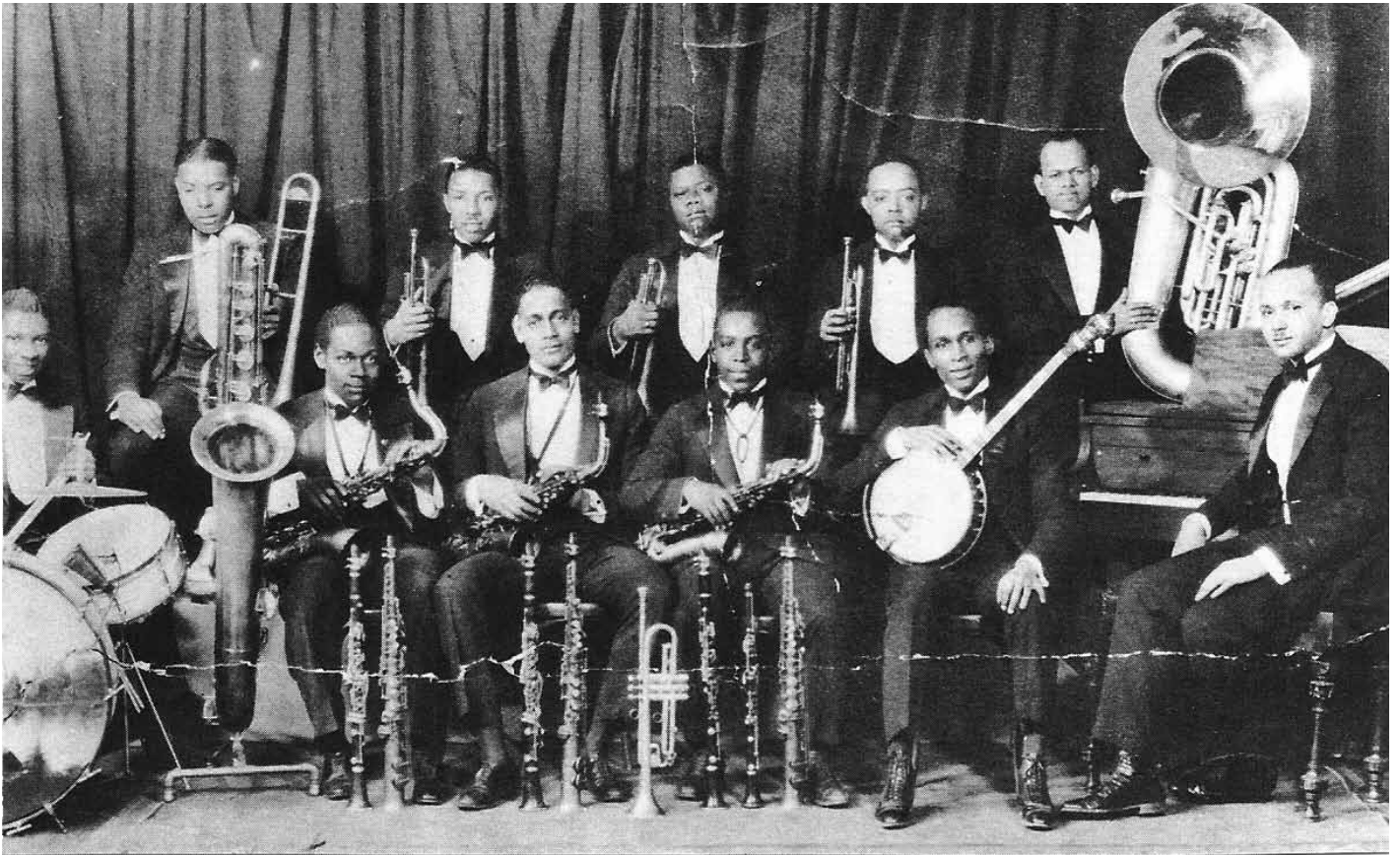
Fletcher Henderson Orchester, etwa 1925. Als Begleiter hatte Bessie oft Musiker dieses Orchesters. Von links in der vorderen Reihe: Kaiser Marshall, Coleman Hawkins, Buster Bailey, Don Redman, Charlie Dixon, Fletcher Henderson. Hintere Reihe: Charlie Green, Elmer Chambers, Louis Armstrong, Howard Scott, Ralph Escudero