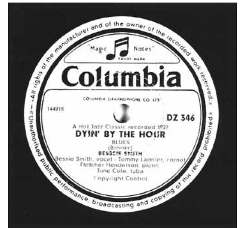
Plattenticket der Columbia DZ 346, eine Ausgabe für die Schweiz