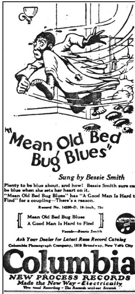
Inserat «Mean old Bed Bug Blues» aus Chicago Defender 19. 11. 1927

Die Reisebedingungen für schwarze Unterhaltungskünstler, speziell in den Südstaaten, waren oftmals katastrophal. Da ihnen sogar drittklassige Hotels versperrt waren, mussten sie in Mietwohnungen für «Farbige» oder bei afroamerikanischen Familien Unterkunft suchen. Manchmal standen ihnen nur abbruchreife Gebäude zur Verfügung, oder sie waren gezwungen im Freien zu übernachten. Dazu kamen die gelegentlichen Belästigungen durch den Klu-Klux-Klan. Eine Verbesserung trat erst ein, als Bessie sich einen eigenen Reisewagen anschaffte. Dieser diente fortan als Ess- und Schlafgelegenheit und bot auch Platz als Depot für Requisiten.