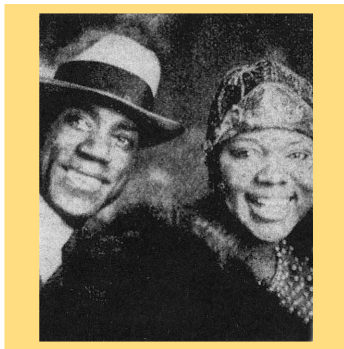
Jack und Bessie im Jahre 1923

Inserat «Gulf Coast Blues» (aus Chicago Defender 26. 5. 1923). Es handelt sich um Bessies erste Plattenaufnahme für Columbia