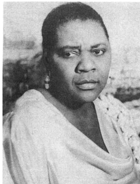
Bessie Smith 1936 im «Carl Van Vechten Studio»

Bei vielen Einspielungen wird sie von einem Pianisten begleitet, so von Clarence Williams, Fletcher Henderson, Fred Longshaw und James P. Johnson. Bei anderen Aufnahmen erfolgte der Zuzug von weiteren Musikern. In den 1920er-Jahren erlebte das Jazzorchester von Fletcher Henderson mit seinen hervorragenden Solisten eine Blütezeit. Es war ein Glücksfall, dass bei vielen ihrer Gesangsaufnahmen Instrumentalisten dieser Band mitwirken konnten.