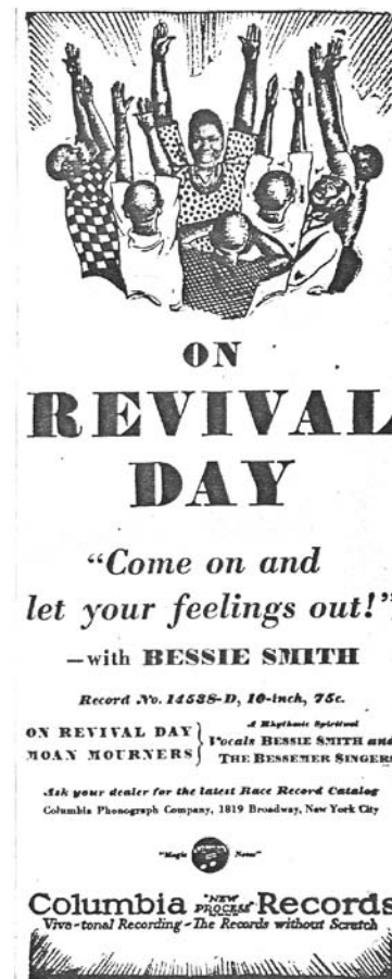
Inserat «On Revival Day» aus Chicago Defender vom 28. 3. 1930