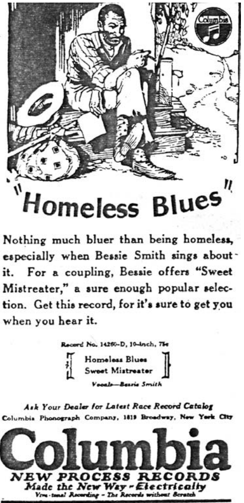
Inserat «Homeless Blues» aus Chicago Defender 17. 12. 1927