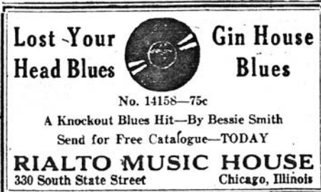
Inserat «Lost Your Head Blues» aus «Chicago Defender» 9. 10. 1926

Die Reisebedingungen für schwarze Unterhaltungskünstler, speziell in den Südstaaten, waren oftmals katastrophal. Da ihnen sogar drittklassige Hotels versperrt waren, mussten sie in Mietwohnungen für «Farbige» oder bei afroamerikanischen Familien Unterkunft suchen. Manchmal standen ihnen nur abbruchreife Gebäude zur Verfügung, oder sie waren gezwungen im Freien zu übernachten. Dazu kamen die gelegentlichen Belästigungen durch den Klu-Klux-Klan. Eine Verbesserung trat erst ein, als Bessie sich einen eigenen Reisewagen anschaffte. Dieser diente fortan als Ess- und Schlafgelegenheit und bot auch Platz als Depot für Requisiten.