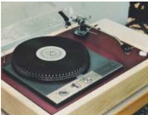
Garrard 401 mit SME 3012 R

Bei der Aufnahme der Musik auf eine Schallplatte werden tiefe und hohe Frequenzen unterschiedlich laut verstärkt: