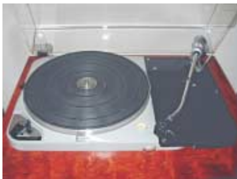
Thorens TD 124 mit Ortofon Tonarm

Als Laufwerk dient mir der altbewährte Thorens TD 124 in seiner Mk.II- Version. Dieses Kultgerät wurde von Thorens von 1957 bis 1965 gebaut, anschliessend bis 1968 in der Mk.II- Version, also wurde es auch noch ein Jahr weiter produziert, nachdem das Nachfolgergerät, der TD 125, bereits eingeführt war. Weitere 2 Geräte des Typus TD 124 stehen als Reserven bei mir im Keller bereit, eines wird vermutlich mit einem SME 3009 Arm und einem Ortofon SPU Mono GM 65 Tonabnehmer für das Abspielen von Schellackplatten bereitgestellt, damit ich den Tonabnehmer nicht mehr wechseln muss.