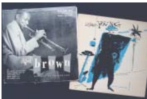
Über genauere Hörerfahrungen...

Ich habe die arroganten Argumentationen und die plumpen Werbekampagnen der Plattenfirmen, der Geräteher-