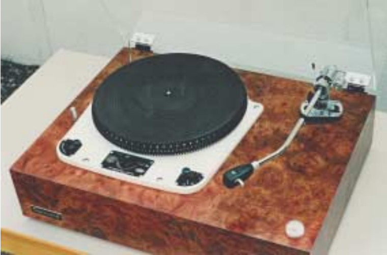
Garrard 301 mit SME 3012 Tonarm

erst in der letzten Phase kamen sie aus deutscher Fertigung aus Lahr im Schwarzwald. Ich empfehle allen Besitzern den erwähnten Aluschnellstartteller nicht zu entfernen; es können nicht nur 17cm Singles und 25cm Platten leichter aufgelegt und entfernt werden, es gibt auch eine viel kleinere Belastung der mechanischen Teile und der Achse mit Teller, was sich in deutlich längeren Wartungsintervallen auszahlt. Zusätzlich bringt der Teller auch noch eine bessere Isolation vor magnetischen Feldern, was sich bei bestimmten Tonabnehmern als unverzichtbare Barriere empfiehlt und so unangenehme Brummgeräusche verhindert.