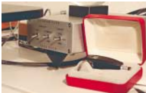
Der GSP Jazz Club findet auf kleinem Raum Platz

Die Preise liegen mit rund Fr. 900.– im mittleren Preissegment. Sie sind also im Vergleich mit einem Denon 102, welches aber nur Pseudomono reproduziert und rund Fr. 400.– kostet, zwar deutlich teurer, aber immer noch viel billiger wie ein Lyra Helikon Mono, welches zirka Fr. 2500.– kostet. Die günstige Alternative wäre wohl ein Shure MM-Tonabnehmer, welcher unter Fr. 100.– zu haben ist, aber nicht die Auflösung und Transparenz eines Ortofon bieten kann und deshalb nur teilweises als billige Alternative gelten kann. Auch hier unterscheiden sich die Begriffe günstig und billig in eindeutiger Manier. Aus eigenen Hörerfahrungen kann ich bestätigen, dass sich auch hier die Investition bei der Quelle in Form eines guten Tonabnehmers lohnt. Und diese Quelle ist die Monorille, die so viel mehr Informationen beinhaltet, wie sich die, welche das noch nicht erlebt haben, wohl nur erträumen können...!