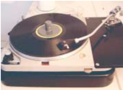
Der Thorens TD 124 des Autors mit dem langen SME Tonarm

Schallplatten gibt es seit Ende des 19. Jahrhunderts. 1897 verwendete Emil Berliner erstmals Schellack als Material für Schallplatten. Durch die Verbesserung des Materials wurden die Nebengeräusche geringer und die Platten zerbrachen nicht mehr so leicht. Schellackplatten wurden bis ca. 1960 hergestellt. Bereits in den Jahren 1948–50 tauchten die ersten Vinyl-Schallplatten auf, welche in den nächsten 10 Jahren die Schellackplatten rasch verdrängten, da sie sehr gute klangliche Eigenschaften hatten und nebst der leichteren Herstellung auch nochmals weniger zerbrechlich waren.