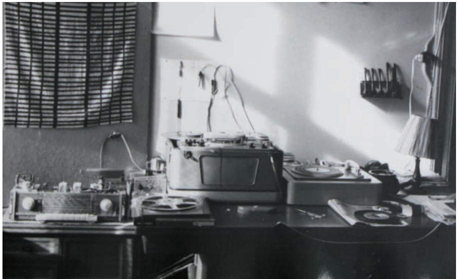
Zwei Bilder aus den Anfangszeiten des Hi-Fi- und Tonband-Bastlers, mit obligater Pfeife (1957)