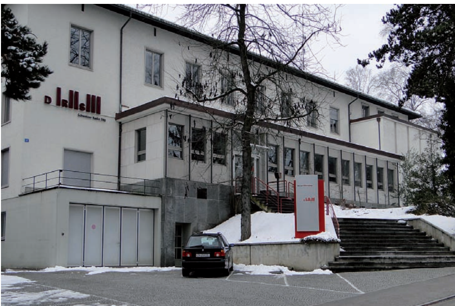
Das Radiostudio Basel im März 2010: Wie geht es weiter? Was bleibt in Basel? Zur Zukunft von Gebäude und Radio Basel ist im Moment einiges unklar.

E.M.: Ich bedanke mich im Namen unserer Mitglieder herzlich für das interessante Gespräch.