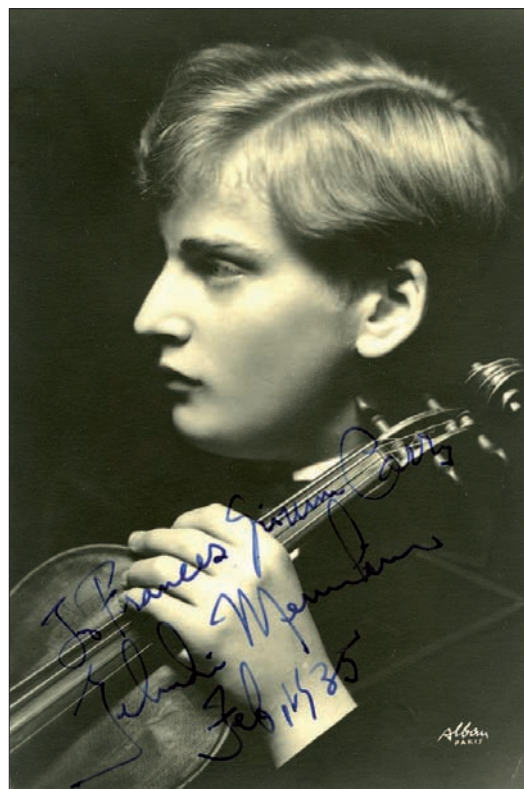
Der junge Yehudi Menuhin

FATIOSTR. 35 • CH-4056 BASEL • TEL 061 321 66 11