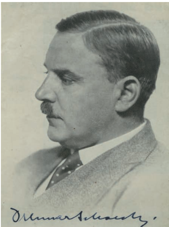
Othmar Schoeck 1937

Man kann nicht behaupten, dass die Schweiz ihrem Landsmann Schoeck (1886–1957) besondere Aufmerksamkeit zukommen lässt. Zwar gibt es eine Othmar Schoeck-Gesellschaft mit Sitz in Zürich ( www.othmar-schoeck.ch ), die sich seit langer Zeit für die Verbreitung des Werkes dieses wesentlichen Schweizer Komponisten des 20. Jahrhunderts einsetzt, doch sind Schoecks Werke im Konzertleben unseres Landes nur selten anzutreffen. Das mag daran liegen, dass Schoeck primär als Liedkomponist gilt – er hat einige hundert Klavierlieder hinterlassen. In Plattenveröffentlichungen haben sich Sänger wie Dietrich Fischer-Dieskau (auf DGG und Claves), Ernst Haefliger (auf Jecklin), Arthur Loosli (EMI) oder Kurt Widmer (PAN) für Schoecks Liedschaffen eingesetzt. Schoeck hat aber auch Bühnenwerke geschrieben – immerhin ist seine Kleist-Oper «Penthesilea» in den letzten Jahren wieder vereinzelt auf Spielplänen von Opernhäusern aufgetaucht – und Orchestermusik komponiert – hie und da ist das Streicherwerk «Sommernacht» op. 58 zu hören. Lohnend ist vor allem auch Schoecks Kammermusik, die auf LPs immer wieder als Occasion zu finden ist. Empfehlenswert sind die beiden Streichquartette, welche das «Neue Zürcher Streichquartett» 1981 eingespielt hat (PAN 130 048) sowie die beiden Violinsonaten, die der Geiger Ulrich Lehmann mit dem Pianisten Charles Dobler 1986 auf Ex Libris (LP EL 16990, digital) vorgelegt hat.