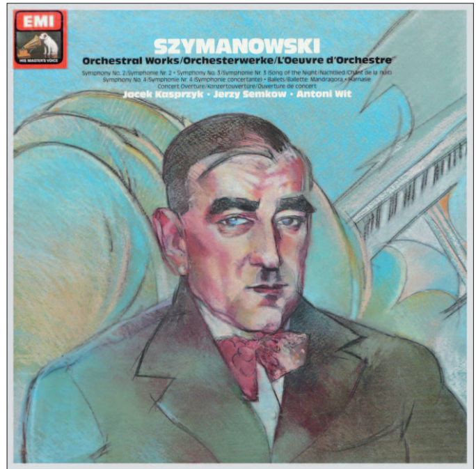
Ein Porträt des Komponisten Szymanowski, wie es auf dem EMI-Album mit Orchesterwerken erscheint (SLS 5242 oder 1C 165-43 210/12).