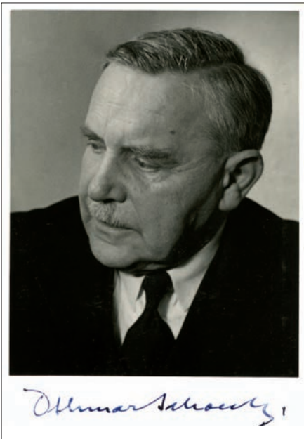
Othmar Schoeck um 1945

Nach Anhören der drei Aufnahmen, sind Beat Wyss und der Schreibende zum Schluss gelangt, dass es nicht entscheidend ist, welche Aufnahme man hört. Sicher aber ist, dass dieses zu Unrecht kaum gespielte schöne Violinkonzert unbedingt in eine Sammlung von Violinliebhabern gehört!