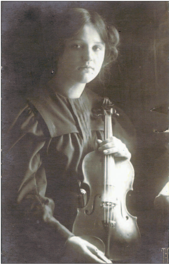
Stefi Geyer: ihr widmet Schoeck sein Violinkonzert