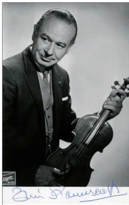
Zino Francescatti (Foto mit Autograph)

Die Einspielung von Heifetz mit dem Komponisten William Walton am Pult aus dem Jahre 1950 besticht durch eine im positiven Sinne rationale Planung des Gesamtkonzepts. Da ist eine grosse Brillanz des Geigenspiels zu bewundern, dosiert im lyrischen, stets präzise und perfekt in den bewegten Teilen. Im letzten Satz scheint Heifetz alle Möglichkeiten des Geigenspiels voll auszuschöpfen. Die Monoaufnahme klingt dem Aufnahmejahr angemessen gut.