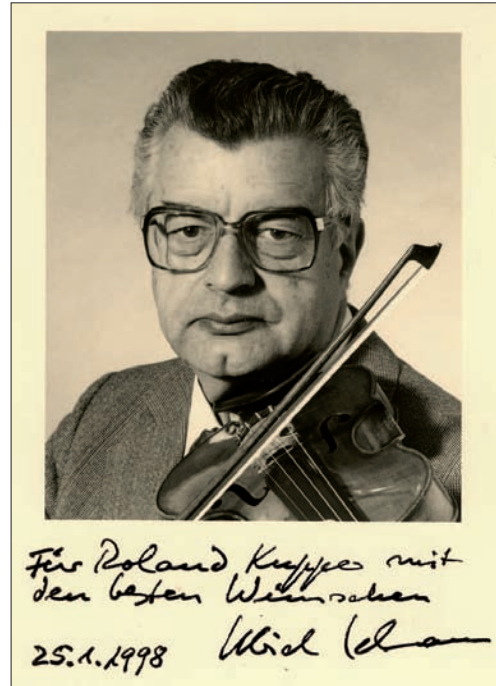
Foto mit Autograph des Geigers Ulrich Lehmann. Seine Aufnahme des Violinkonzerts von Schoeck war auf LP lange Zeit die einzige.

Die Einspielung von Ulrich Lehmann (geb. 1928) mit dem Zürcher Kammerorchester unter Edmond de Stoutz vermag von Beginn an zu überzeugen. Da ist zunächst der wundervoll lyrische Ton des Solisten zu erwähnen. Lehmann geht mit einem bewusst fragilen Ton an das Werk. Die Violine ist aufnahmetechnisch zwar im Vordergrund, steht jedoch in einem guten Zusammenspiel mit dem Orchester. Uns lagen eine gute Pressung von Ex Libris und eine Monopressung von Amadeo vor. Die Ex-Libris-Platte ist klar vorzuziehen. Die Geige steht hier weniger im Vordergrund und man hört deutlich mehr im Orchester.