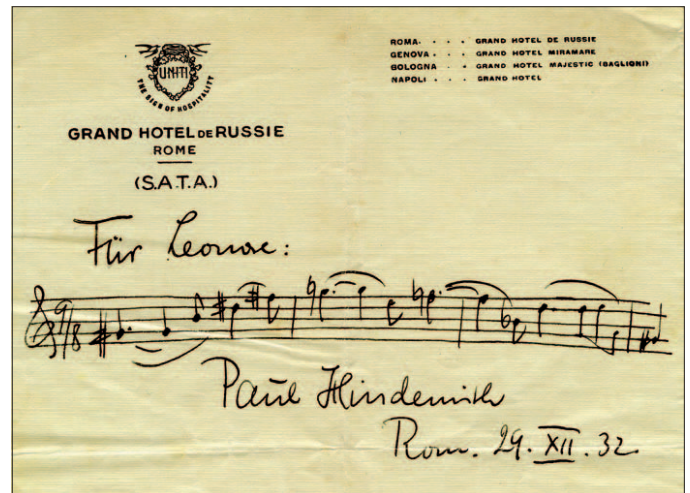
Autograph von Hindemith aus dem Jahre 1932